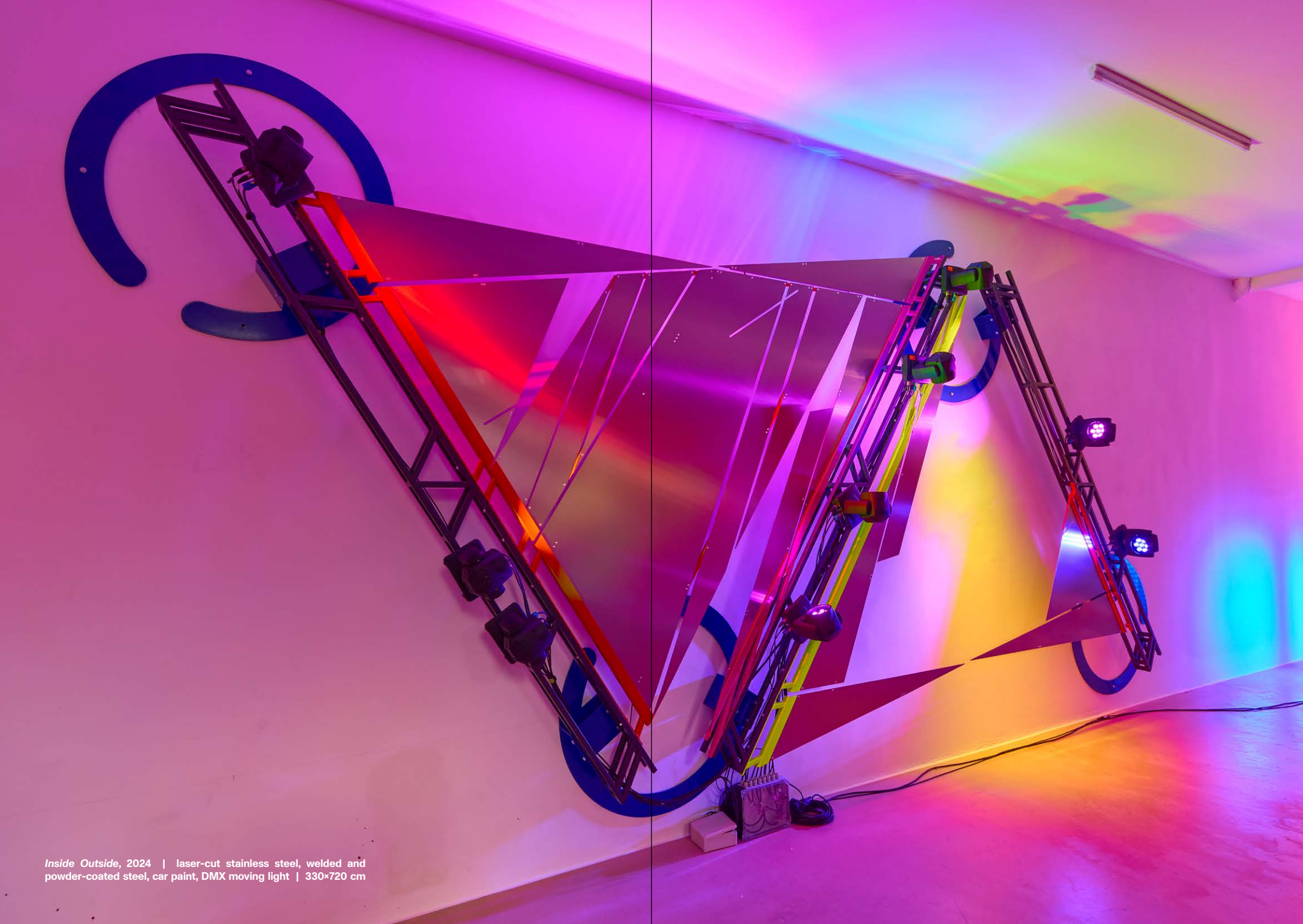
Inside Outside, 2024 | laser-cut stainless steel, welded and powder-coated steel, car paint, DMX moving light | 330×720 cm