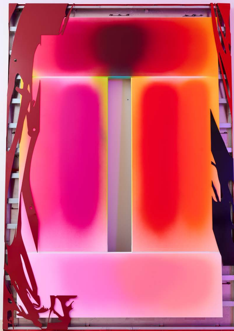
Eclipse 11 and Eclipse 12, 2024 | preparatory phase | P5 LED wall, laser-cut stainless steel sheet, welded and powder-coated steel, car paint, acrylic, canvas, wood | 325x225 cm