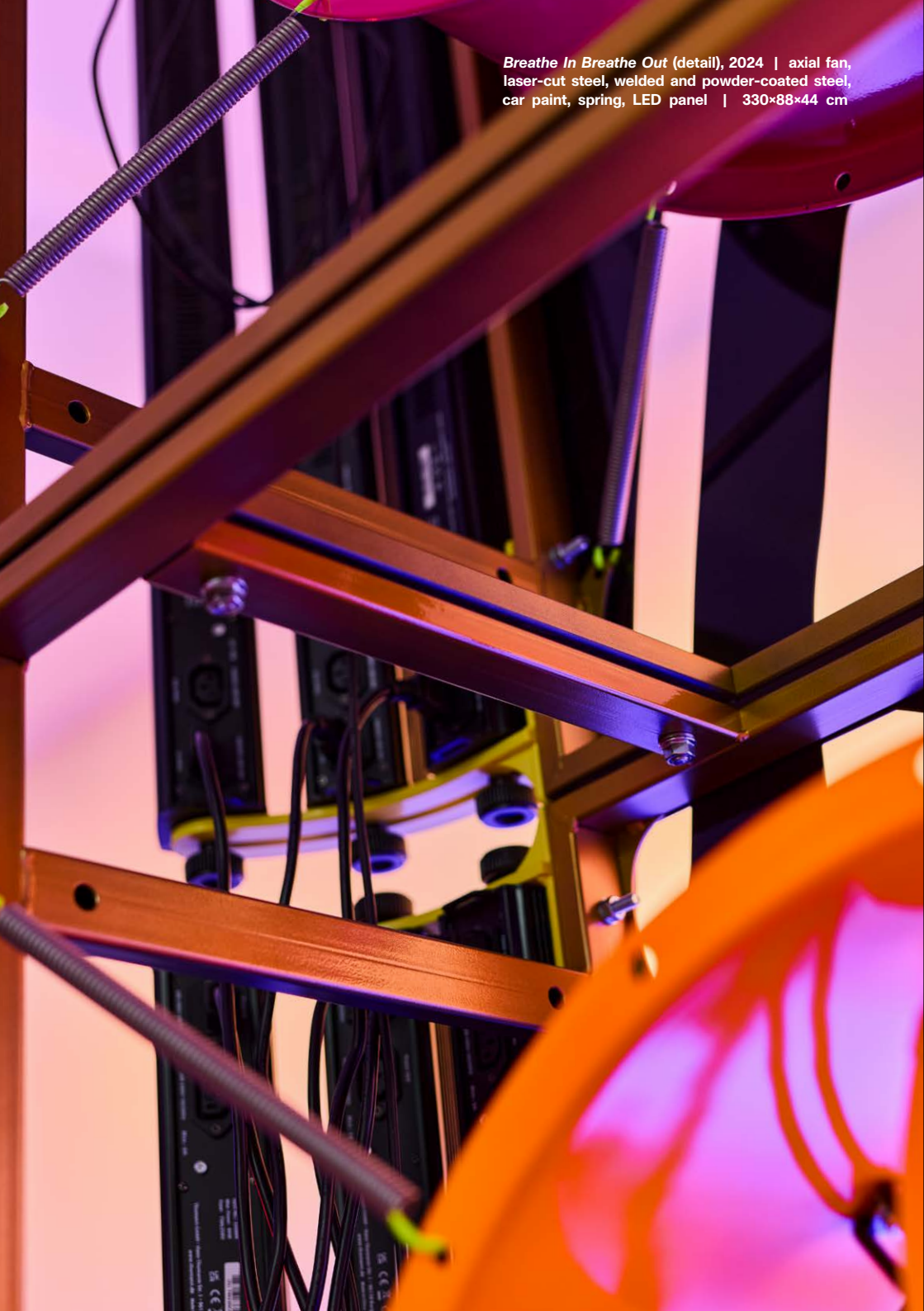
Breathe In Breathe Out (detail), 2024 | axial fan, laser-cut steel, welded and powder-coated steel, car paint, spring, LED panel | 330×88×44 cm