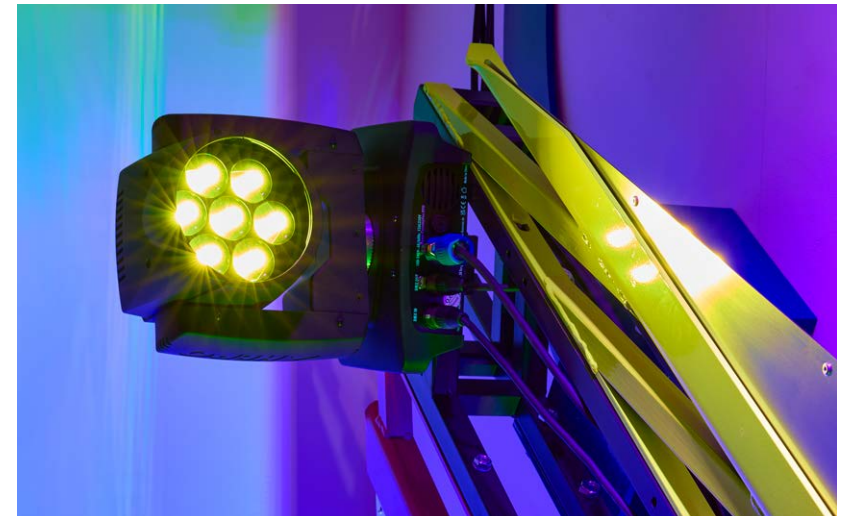
Inside Outside (detail), 2024 | laser-cut stainless steel, welded and powder-coated steel, car paint, DMX moving light | 330×720 cm

A year later, he was awarded the Esterházy Art Award for emerging artists, which resulted in the acquisition of his large-scale work by the Ludwig Museum – Museum of Contemporary Art in Budapest. His work has been exhibited in several European galleries (acb Gallery, Budapest; Fold Gallery, London; Annka Kultys Gallery, London, 193 Gallery, Paris and Erika Deák Gallery, Budapest) as well as public institutions in Hungary (Modem, Debrecen; King St Stephen Museum, Székesfehérvár; Paks Gallery, Paks; Institute of Contemporary Art, Dunaújváros). He has participated in international exhibitions such as Haunting Monumentality at MSU Zagreb (2014), Falling Out the Rythm at BWA Warsaw (2019), Abstract Hungary at Künstlerhaus – Halle für Kunst und Medien in Graz (2017), as well as Place Value – New Acquisitions at Ludwig Museum – Museum of Contemporary Art in Budapest (2022) and New Mediations at Modem in Debrecen (2022-2023). He is represented by acb Gallery (Budapest) and Double Q Gallery (Hong Kong). In 2024, he founded the Kazinczy 51 Art Hub in Budapest. He lives and works in New York and Budapest.